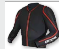
ORTHO-MAX Jacket Protektorenjacke