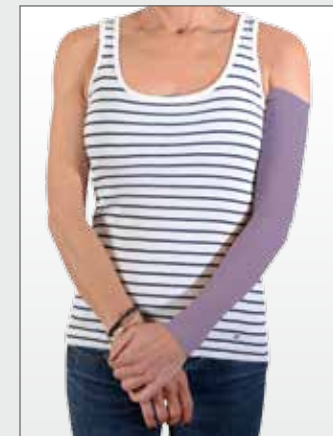
Kompressionsbehandlung von Narben und nach Verbrennungen