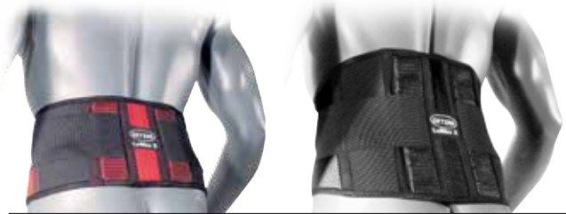
Version "Low" (Gurthöhe 16 cm)