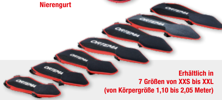
Erhältlich in 7 Größen von XXS bis XXL (von Körpergröße 1,10 bis 2,05 Meter)