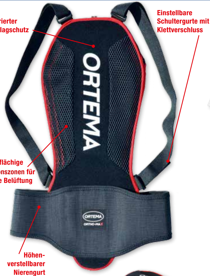
Einstellbare Schultergurte mit Klettverschluss