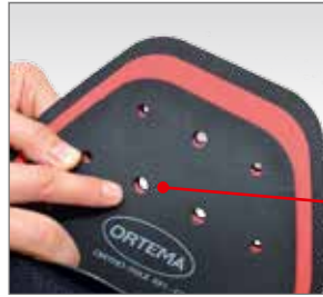
Großflächige Ventilationszonen für optimale Belüftung