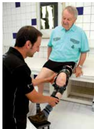
Versorgung eines Arthrose Patienten mit einer K-COM Knieorthese