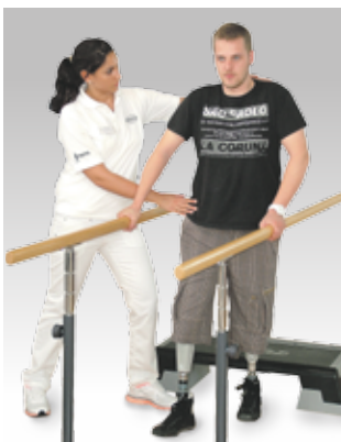
Gehschultraining eines Prothesepatienten mit unseren Spezialisten

ORTEMA ist fachlich direkt mit der Orthopädischen Klinik Markgröningen (OKM), dem Klinikum Ludwigsburg sowie etlichen orthopädischen Facharztpraxen und niedergelassenen Medizinern verbunden. Dieses Modell der vertrauensvollen Zusammenarbeit ist nahezu einmalig und bewährt sich seit über 25 Jahren. Bei ORTEMA selbst arbeiten Orthopädie-Techniker, Physio-, Ergo- und Sporttherapeuten, Dipl. Sportwissenschaftler sowie Reha-Mediziner Hand in Hand für eine umfassende Versorgung.